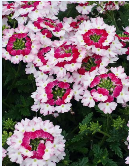
Fot. 5. Verbena Lanai Twister 'Cherry Red'

Lobelia. Do nowej, rozmnażanej vegetatywnie grupy lobelii przylądkowej ( Lobelia erinus ) – Techno Heat Up ,