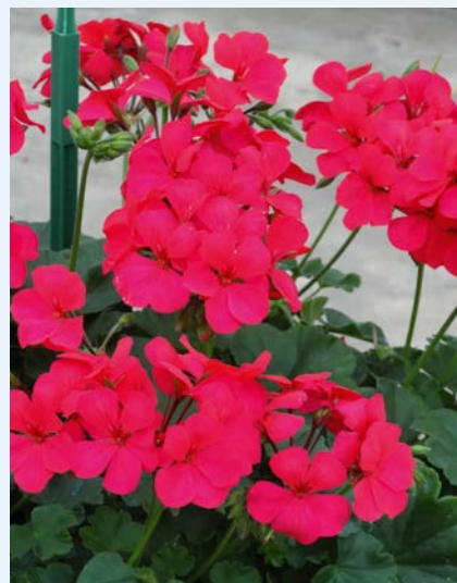
Fot. 2. Pelargonium Caliente ‘Hot Rose’

Kalibrachoa. Reprezentowana jest w ofercie FloriPro Services przez grupę Callie , w której pokazano 6 nowości (w tym dwie odmiany ulepszone). Wyróżniają się odmiany ‘Deep Yellow Impr.’ (żółta, o dobrym wyrównaniu roślin) oraz ‘Burgundy’ (oryginalny, purpurowobordowy kolor kwiatów).