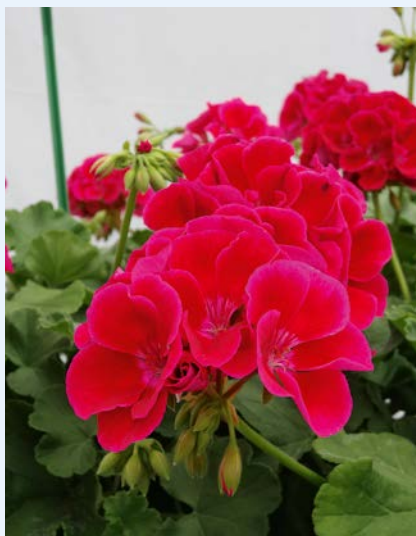
Fot. 1. Pelargonium Calliope ‘Red Splash’

W grupie Caliente , która wykazuje więcej cech pelargonii bluszczolistnej (podczas gdy Calliope bardziej przypomina pelargonię rabatową – P. zonale ), pojawiły się dwie ciekawe nowości o kwiatach pojedynczych, ale tworzących okazałe, liczne kwiatostany, samoczyszczące się i stanowiące długotrwałą ozdobę rośliny. U odmiany