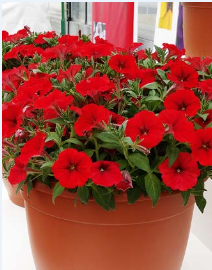
Fot. 4. Petunia Sanguna Patio 'Red'

do produkcji w doniczkach 13-centymetrowych (rośliny intensywnie się krzewią, ale osiągają mniejsze rozmiary niż w przypadku standardowej, popularnej grupy Gallery).