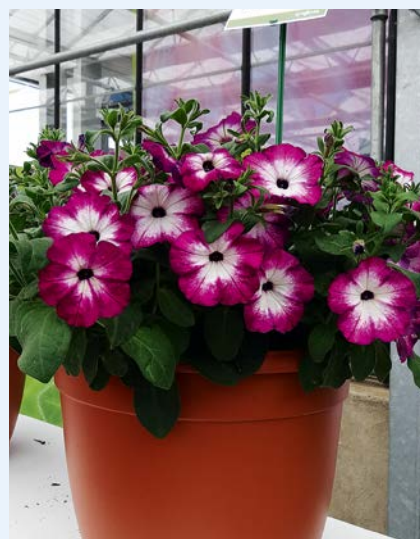
Fot. 3. Petunia FP Select Sanguna ‘Twirl Purple’

Werbeny. Osiągnięciem hodowlanym przedsiębiorstwa Syngenta jest grupa Lanai Twister , z którą wprowadzono na rynek niepowtarzalny układ kolorystyczny kwiatostanów werbeny (najpopularniejsza odmiana – Lanai Twister ‘Red’). W tym roku dodano kolejne kreacje tego typu (m.in. ‘Cherry Red’ o wiśniowo-różowo-białych kwiatach, fot. 5), które B. Pierzchalski nazwał odmianami „nowej generacji” w grupie Lanai, mającymi ulepszony pokrój i większe kwiatostany.