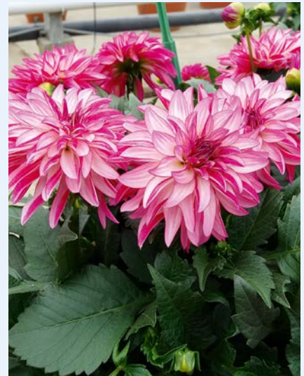
Fot. 6. Dahlia Grandalia 'Rose Swirl'

Inne. W obrębie uzupełniającego asortymentu szczególną uwagę zwracała scewola wachlarzowata ( Scaevola aemula ) Whirlwind 'Early Compact White' o czysto białych kwiatach i zwar-